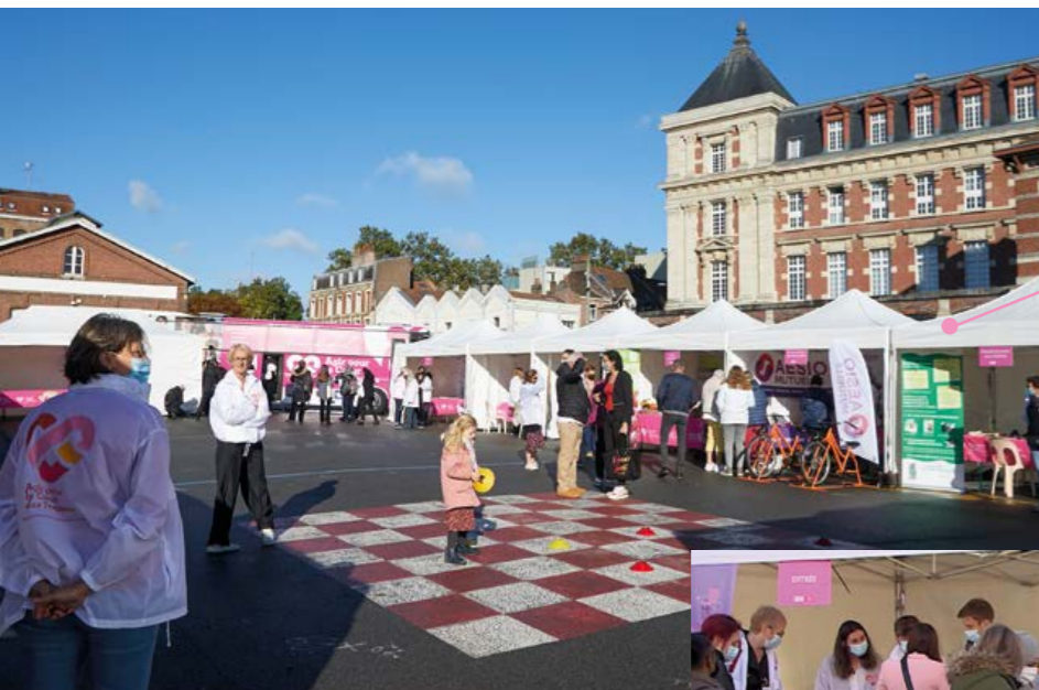
Martine Aubry, maire de Lille

« Tous ces actes de prévention qui peuvent paraître simples sont en fait méconnus par une partie de la population. Cela me fait très plaisir de lancer depuis Lille une action bienveillante qui va aller partout en France. C'est une action de service public, pour tout le monde, car l'accès à la santé est un droit majeur. Les dames sont heureuses et disent avoir compris des choses qu'elles ne connaissaient pas. Elles savent à quoi elles doivent faire attention. Nous n'avons pu inscrire qu'un peu plus de 200 personnes, nous avons eu beaucoup de demandes, il faudra que le Bus revienne. »