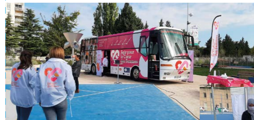
Cécile Defrance, cardiologue au centre de rééducation du Lavarin à Avignon